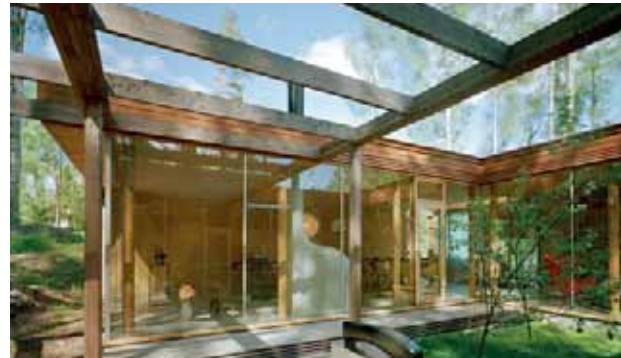
© Olavi Koponen / Jussi Tiainen